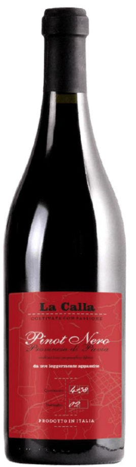
«La Calla» Pinot Nero, Provincia di Pavia