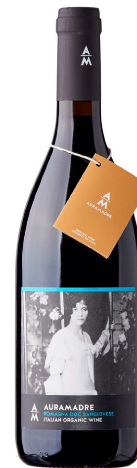
«Auramadre» Sangiovese, Romagna