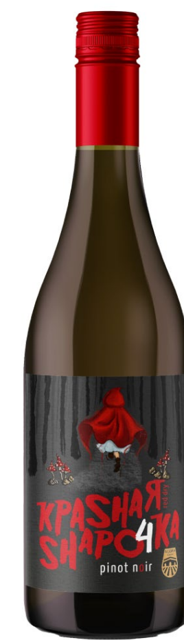
«Krasnaya Shapochka» Agora